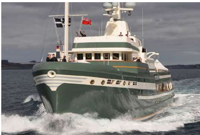
LP Design 55m Steel, varato nel 2009.

Il Commodore 57 e il 55m Steel sono due navi dal design classico, funzionali e robuste. Possono ospitare gli ospiti in tutta sicurezza anche nelle condizioni più avverse.