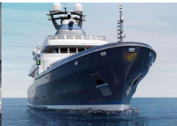
L'imponente prua del Commodore sfoggia uno stemma araldico.

Per quanto riguarda le linee esterne, questa imbarcazione è caratterizzata da un'estetica duratura e forme marittime collaudate che garantiscono comfort sia in navigazione che in rada. La prua svasata e lo specchio di poppa a forma di cuore assicurano una navigazione confortevole.