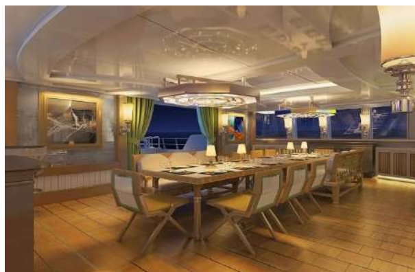
Skylounge nella sua configurazione sala banchetti.

Liebowitz & Partners https://LPdesignUK.com/ Commodore 57 http://www.commodore57.com/