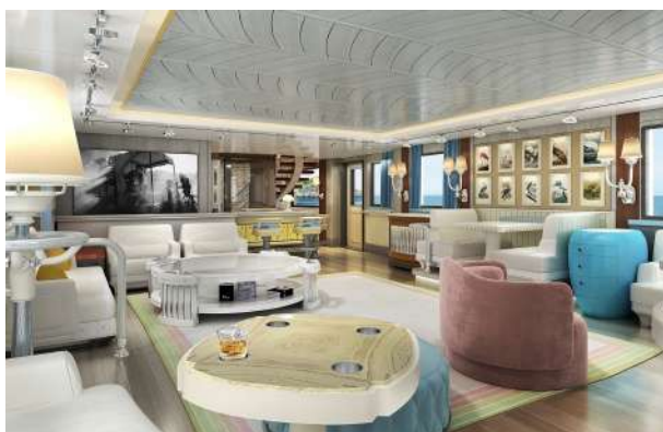
Main saloon del Commodore 57.

Anche all'interno del Commodore, troviamo spazi multiuso : la hall degli arrivi funge anche da drink bar e lo skylounge può essere usato sia come salone diurno, sala lettura, sala banchetti formale o sala meeting.