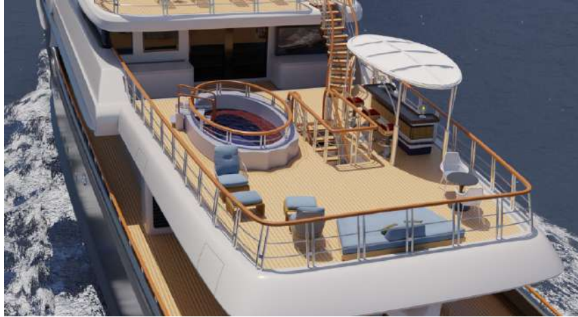
Il deck lounge comprende una jacuzzi e un drink bar all'ombra.

Il Commodore 57 offre una vasta gamma di spazi che possono accomodare sia gruppi numerosi sia compagnie ristrette. Questo Explorer dal layout funzionale presenta alcune aree che si adattano a più usi , come ad esempio il ponte di poppa o lo Sky Lounge.