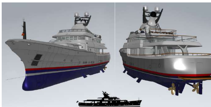
Prua dal design svasato e specchio di poppa a forma di cuore.

Il design dello scafo, la presenza di grandi tender, gli spazi di coperta versatili, e un layout funzionale rendono il Commodore un'efficace imbarcazione da diporto.