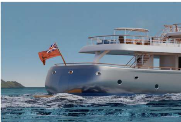
Vista da poppa della porta a conchiglia e della piattaforma.

L'area del beach club comprende una sauna (una Banya circolare a vapore) e una suite per trattamenti e massaggi. A poppa, una porta a conchiglia garantisce l'accesso ad una piattaforma in teak. Una seconda piattaforma a sbalzo sorge a babordo.